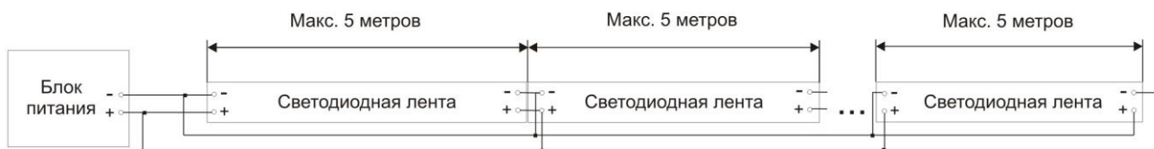
Схема подключения RGB ленты :